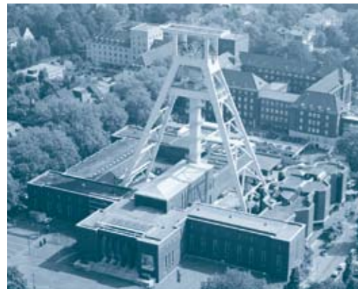
Das Deutsche Bergbau- museum in Bochum

im Foyer des Hörsaalzentrums, musikalische Begleitung: Duo „Wiener Melangerie“ aus Bochum